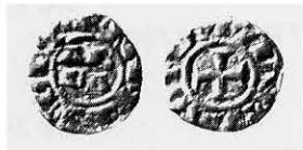
Alba - Denaro Imperiale Raccolta reale, Ex-collezione Marignoli [CNI, II, tav. 1, n.8]