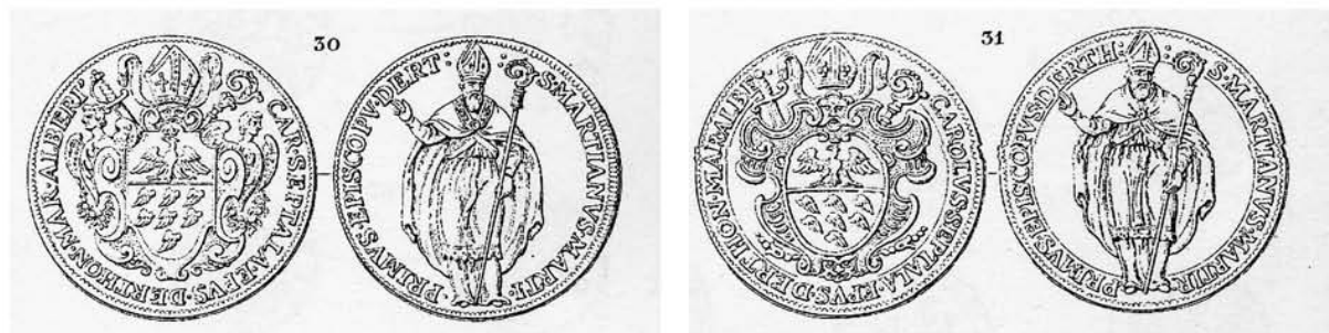
Le monete da 54 e 27 Soldi milanesi di Carlo Settala [Promis 1866, tav. III, n. 30-31]