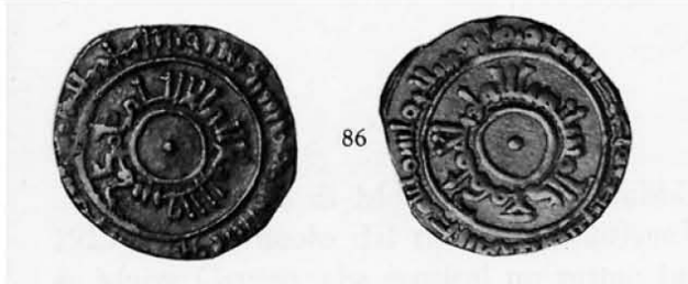
Tari di Agrigento [Lowick 1986, P.159, tav. p. 165, n.86]