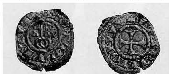
Denaro paparino attribuito da Lisini ad Acquapendente [Artemide Aste, aprile 2003, n. 650]