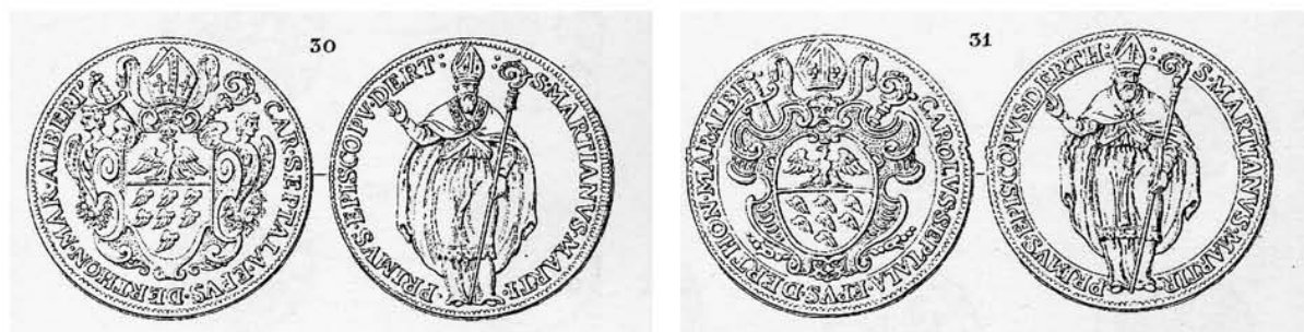
Le monete da 54 e 27 Soldi milanesi di Carlo Settala [Promis 1866, tav. III, n. 30-31]